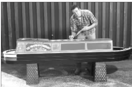
木工在打造小船模样的棺材