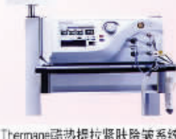
Thermage酷热提拉紧肤除皱系统