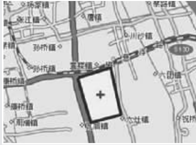
据称,上海迪斯尼项目选址位于浦东川沙功能区的黄楼社区与原南汇交界处

万众瞩目的上海迪斯尼主题乐园项目终于在昨天水落石出。根据上海市人民政府新闻办公室4日上午的授权发布,上海迪斯尼项目申请报告已获国家有关部门核准。中美合作双方正就合作的具体内容和细节进行深入磋商,将长期合作在上海浦东新区共同建设世界一流的迪斯尼乐园。 来自美国华特迪斯尼公司的消息称,项目的初始阶段将包括一个具有为上海地区量身打造的“神奇王国”主题乐园和与全球迪斯尼旅游目的地度假区一致的其他设施。目前中美双方关于“最终协议”的谈判已经进入冲刺阶段。上海迪斯尼主题乐园及配套施设施区域首期规划开发面积约4平方公里,将以占地约1平方公里的主题乐园园区为主要核心区,投资规模约250亿元人民币,首期开发建设工期计划用5年至6年时间完成。 据悉,上海迪斯尼乐园将不但拥有与全球迪斯尼旅游目的地度假区一致的设计,还将具有中国本土的神奇特色。具体规划细节仍在磋商中,将在建设和运营乐园的最终协议签署之际,也就是明年上半年对外公布。 本版文章署名均来自新华社,新浪