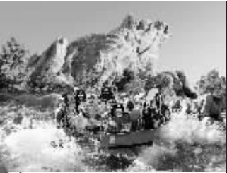
美国加州洛杉矶迪斯尼