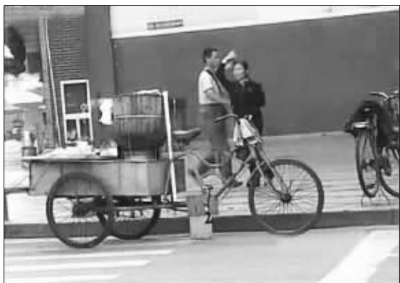
夫妻俩快乐地起舞(视频截图)

交叉步、踢腿、旋转，回头对视……踩着劲爆的探戈节奏，一对中年夫妻在清晨的闹市街头旁若无人地跳着，身边还有一辆卖糯米饭团的三轮车，饭桶里冒着腾腾的热气。最近，一段名为《雷人！金华惊现夫妻跳拉丁舞卖早点》的视频受到网友热捧。 视频的最后，有路人停下来买饭团，夫妻俩一人卖饭团、一人收钱，恩爱又默契。