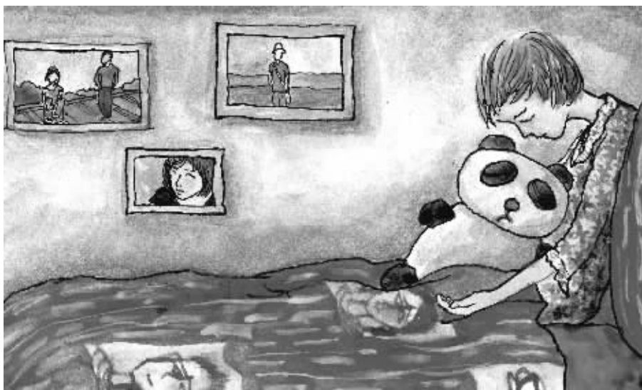
绘图/鲁嘉 插画师 美国 SND 插图奖获得者 已婚

老是睡不着, 抱着它就像抱着他 虽然他每天会准时从地球那端和我视频, 但还是觉得不够 以至于耽误了我的睡觉时间和他的吃饭时间