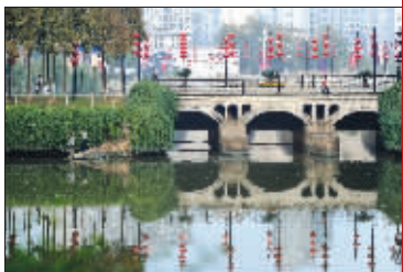
大红灯笼为沧桑的九龙桥添了几分鲜活