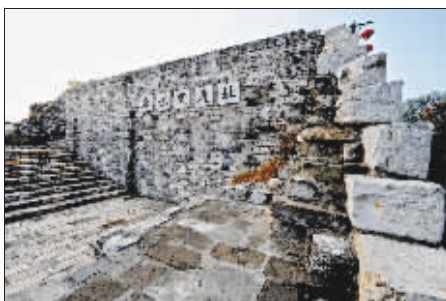
东水关城头,青条石残缺不齐