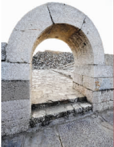
东水关上层拱券塌毁严重,只剩下一个孤单的藏兵洞