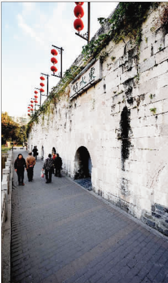
墙体的缝隙里挤着黄黄绿绿的杂草