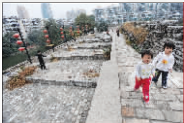
孩子们不知道,脚下的石块已经600多岁了