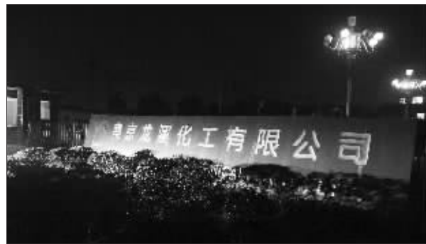
事故就发生在这家公司内

3名工人进入反应釜搞机修,可能第一个进去的人中毒倒下后,第二和第三个人想进去救人,想不到他们一起倒下了。