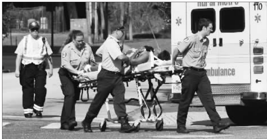
11月6日,在美国佛罗里达州奥兰多市,救援人员运送一名枪击案中的受伤人员

美国人还未从得克萨斯州胡德堡陆军基地枪击案中回过神来,佛罗里达州奥兰多市6日又发生一起枪击案,致死1人,致伤5人。