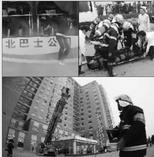
昨天是“119”消防安全日,江苏省消防总队在南京市黄山路和明基医院分别举行了公交车火灾逃生和高层火灾疏散演练,提醒市民如何正确使用安全锤和其他消防器材,以及如何提高遇险自救的能力。

美国联邦集团公司董事长阮可三此次带来了一种新型蔬菜汁的项目,常温下保质期能达1年。家里现榨的蔬果汁,放冰箱也只能保存两三天,新型蔬菜汁为何能1年不变质,阮可三介绍,普通的蔬菜汁是在洗切后直接榨汁,生物特性不稳定、易氧化,因此难保存。而新型蔬菜汁则采用瞬间高压灭菌技术和特殊酸碱配方,在热烫冷冻过程中加入快速转换等新工艺,解决了蔬菜汁的保鲜问题。“这几年我一直居住在美国,美国人餐桌上的饮料离不开蔬菜汁,回国后发现,蔬菜汁在国内还没有流行起来。”阮可三说,有资料统计,美国每年人均消费蔬菜汁50升,而中国人均不到1升。这说明,国内的市场很广阔。目前他们已在上海投资1500万元,种植了生菜、西兰花,年产四五千吨,一年收益有5000万元。现在想在江苏寻求合作。