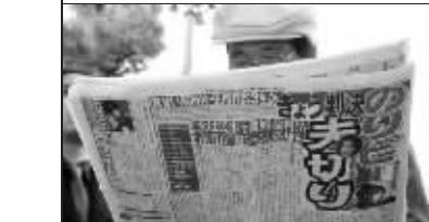
日本民众通过媒体关注酒井法子判决结果