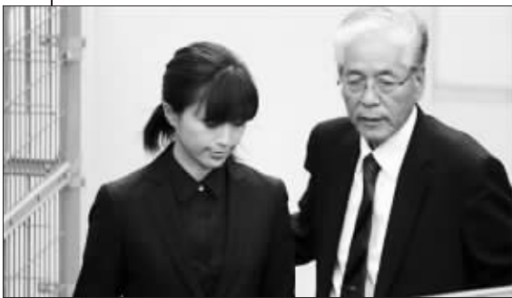
酒井法子着黑色服装出庭