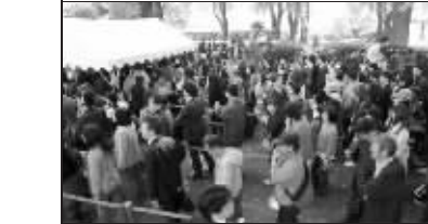
申请旁听的群众排起了长队