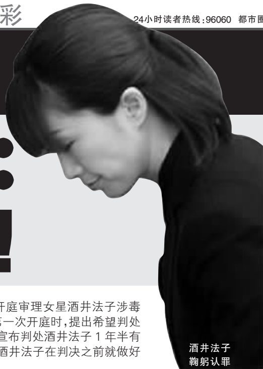
酒井法子鞠躬认罪

昨天上午,日本东京地方法院开庭审理女星酒井法子涉毒案。此前,东京检方在10月26日第一次开庭时,提出希望判处1年半徒刑的要求。结果,昨天法院宣布判处酒井法子1年半有期徒刑,缓期3年执行。知情人称,酒井法子在判决之前就做好了过苦日子的心理准备。