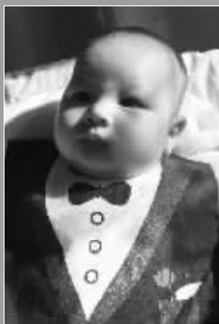
我也有绅士的一面