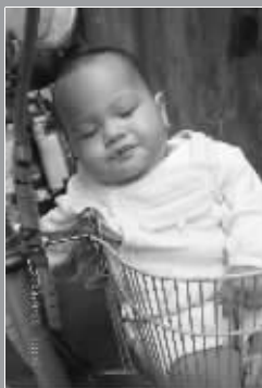
睡觉的地方也很另类