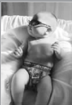
太阳很毒哎, 还好我有墨镜