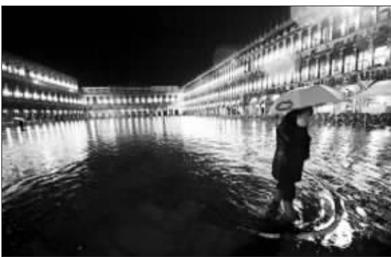
被洪水淹没的圣马可广场

根据官方公布的统计数据,1957年威尼斯常住人口为17.4万人,而1996年这一数字已经下降到7万人。今年10月份公布的常住人口数量则达到历史最低水