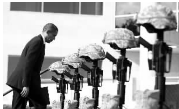
奥巴马在参加悼念仪式

11月10日,美国得克萨斯州胡德堡陆军基地里,数千名美军士兵和一些军人亲友神情凝重,不少人脸上显出挥之不去的哀愁。在13名遇难美国人的装备和照片摆成的纪念台前,美国总统奥巴马和第一夫人米歇尔深深地鞠躬,在悼念仪式讲话中,奥巴马号召军队从胡德堡基地惨剧中汲取力量继续前行。