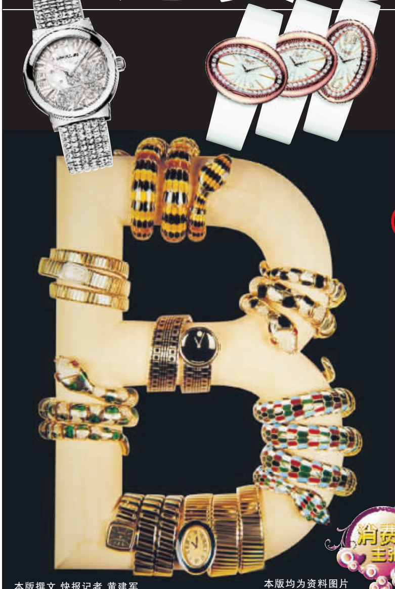
本版撰文 快报记者 黄建军 本版均为资料图片