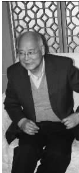
何振梁接受采访时神采奕奕

委员,他也并不是一个毫无原则的人:“如果一定要说我不听招呼,那倒也确实有那么两次。一次是关于女足继续留在奥运会的问题,一次是关于沙滩排球比赛安排在天安门广场进行的问题。我接到他们要求我设法将女足继续留在奥运会的通知时,刚刚设法让执委会们将武术保留在可以考察的项目范围之内。在此之前,国际奥委会有意将武术列入不予考虑的9个项目之一。众所周知,武术是我们的国粹,中国人当然不希望它被打入冷宫。所以,虽然说服的工作很艰难,我还是设法去做了执委会们的工作。但是,这项工作刚刚落实,又增加了女足的问题,老实讲,我也是爱莫能助了,更何况女足并不是中国的强项,所以我就顶了回去。” 结束这次聚会,何振梁老两口手牵着手离开。酒店外大雪正纷纷扬扬地个不停,两人的身影在夜色中显得有些孤单,但何振梁告别时的一番话让人感慨不已:“心底无私天地宽。我已经是80岁的人了,肾一直不好,一个星期还要做三次透析,但只要我还有了一口气,就要为祖国、为人民做有益的事情!” 特约记者 李平