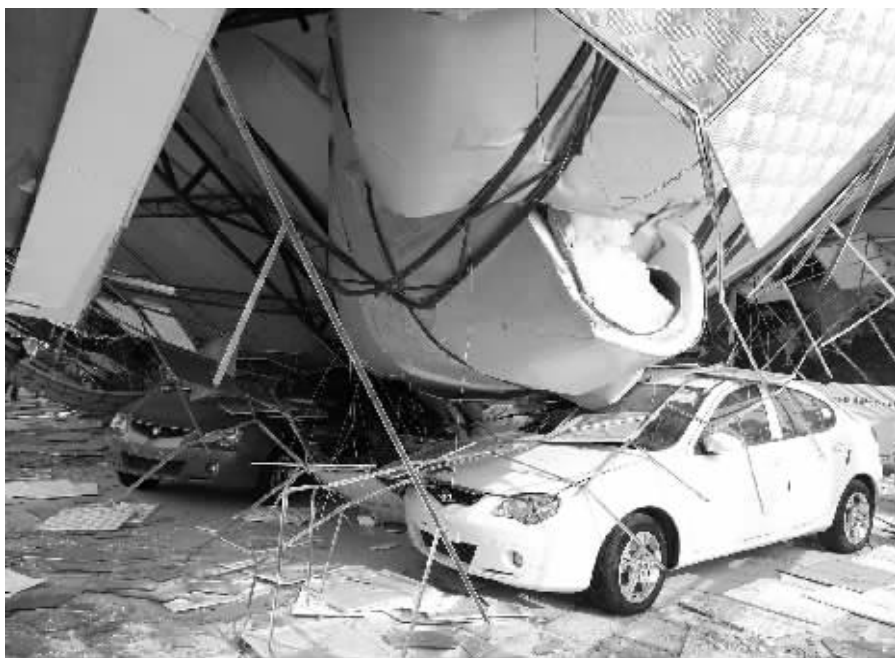
11日,西安一汽车展厅房顶被积雪压塌

另据报道,记者12日从民政部救灾司获悉,针对近期北方地区严重雪灾,国家减灾委、民政部于11月12日10时紧急启动国家三级救灾应急响应,派出工作组赶赴灾区,协助指导地方开展救灾工作。