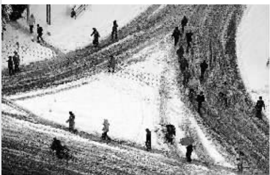
连续的降雪给郑州市民出行带来不便