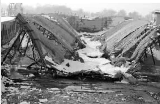
陕西省高陵县通远镇一蔬菜交易市场大棚因雪垮塌