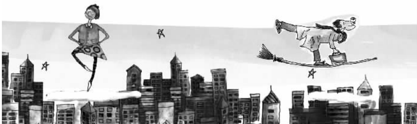
绘图/鲁嘉 插画师 美国SND插图奖获得者 已婚

24小时读者热线:96060 都市圈圈网www.dsqq.cn 责编:杨超 组版:黄伟