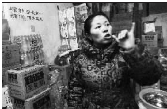
当地居民正在诉说那一刻的“震感”

若想了解现场情况,欢迎登录 http://tv.dsqq.cn/ , 点击观看快报视频新闻。