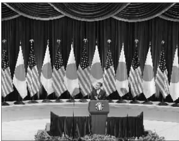
11月14日,奥巴马在东京三得利音乐厅发表美国亚洲政策演讲

谈到经济,奥巴马说,应追求平衡和可持续的增长。全球经济危机表明,主要依赖美国消费和亚洲出口的不平衡经济增长模式不能再继续下去。他呼吁美国以外的经济体开放市场,并表示愿与亚洲国