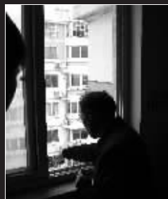
→顾某就是从五楼这个窗口跳下去的