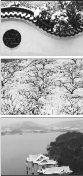
昨天金坛、溧阳迎来今冬初雪(化龙巷网友提供)