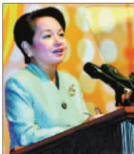
菲律宾总统阿罗约