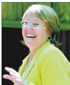
智利总统巴切莱特