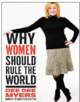
迈尔斯的《为何女性应当统治世界》成为畅销书

2009年11月15日,澳大利亚悉尼,瑜伽援助挑战2009活动的参加者在户外做瑜伽。这项活动将在澳大利亚的各个城市举行,参加者将在108分钟的时间内完成108个拜日式动作,为慈善组织筹集善款。据国际广播电台