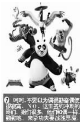
呵呵,不要以为偶很勤奋偶便很寂寞,NO,这些签约冲刺的哥们,姐们很多,他们和偶一样,勤快地,来学功夫要战胜恶魔

把自己比作熊猫,把小升初考试、中考乃至高考比作电影《功夫熊猫》中反面主角“妖魔”的化身,配上泰狼被关在狱中的电影截图和文字。最近,在西安中学生的QQ群里流行起一则为“功夫熊猫最新恶搞中学生学习版”的帖子。短短几天该帖被数十个网站论坛转发,100多万名网友浏览。对此,陕西省社科院副院长石英表示:“这是公众对现行应试教育制度的不满和期待,不容忽视。”