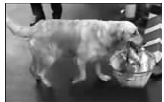
狗狗把捡来的塑料瓶放到篮子里 视频截图