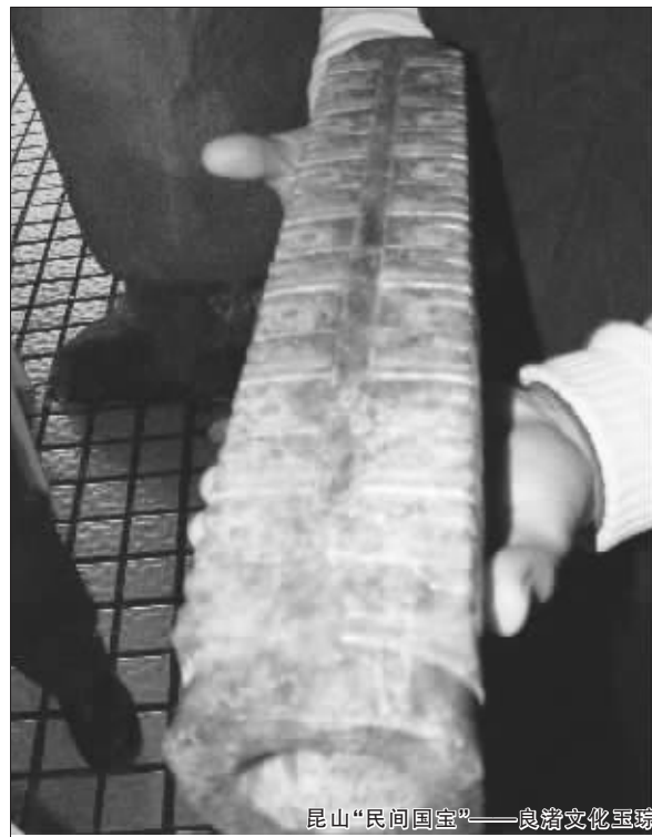
昆山“民间国宝”——良渚文化玉琮