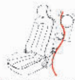
● 21吋宽体设计,全面提升驾乘舒适性。