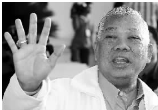
泰国前总理沙马的资料照片(2008年9月9日摄)