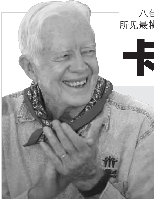
美国前总统吉米·卡特

美国前总统吉米·卡特本月中旬前往泰国清迈,协助开展“卡特工作计划”,为湄公河地区无家可归者援建住房项目。其间,他接受了泰国民族新闻媒体集团总编素提猜·允独家专访。在点评后任执政表现、点评国际时事热点一番后,这位85岁高龄老人出语“惊人”:乔治·W·布什是我一生所见最糟糕的美国总统。