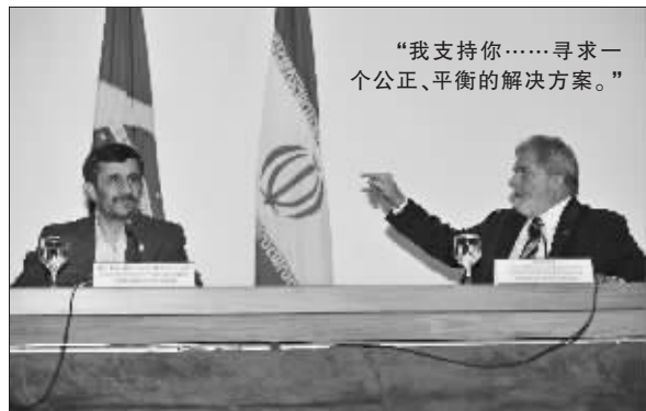
“我支持你……寻求一个公正、平衡的解决方案。”

11月23日,在巴西首都巴西利亚,巴西总统卢拉(右)与到访的伊朗总统内贾德出席记者招待会。