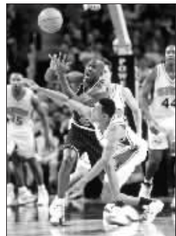
年轻时的艾弗森断乔丹的球

76人在1997年找到了冠军级教练拉里·布朗,但他和艾弗森在一起从没停止过争吵。不过,在篮球场上,布朗为艾弗森打造了一套完美的阵容:穆托姆博、麦基、希尔、斯诺,再加上艾弗森,这样一个阵容,让艾弗森与