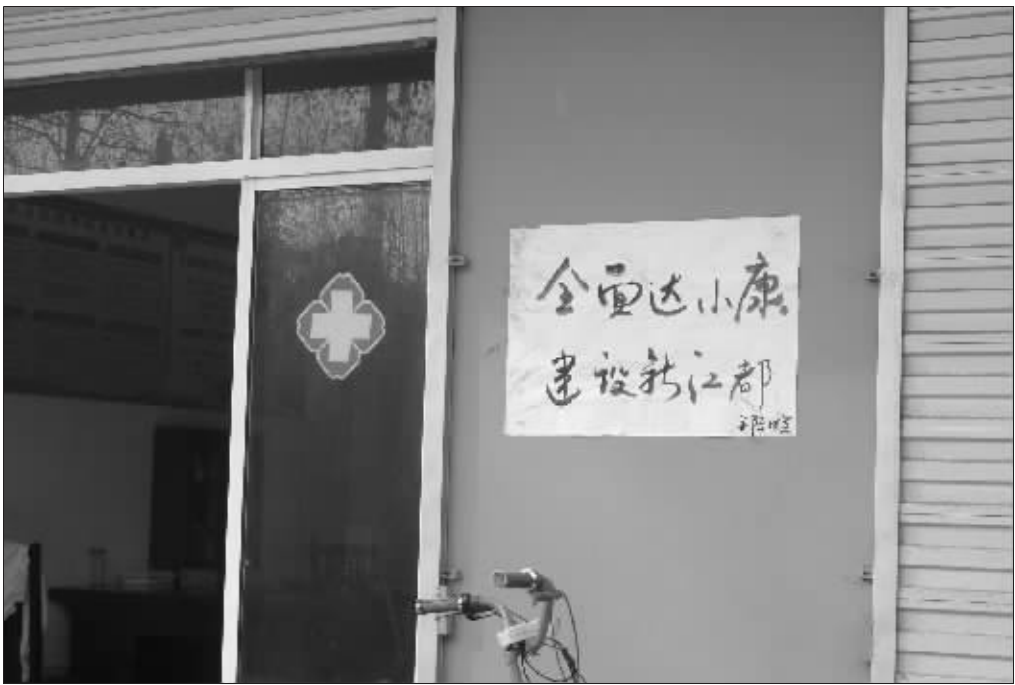
江都市仙女镇金陵村把“小康创建”的宣传标语贴到了大街上

再者,各地普遍存在的社会矛盾也被深化到了小康调查中。贫富的不均,基层干部的不公,或对政府工作的不理解,也很容易被反映