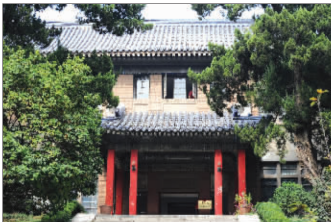
宫殿式建筑的小楼,朱红色立柱和蓝色琉璃瓦贵气十足

没有了琉璃瓦的衬托,“佐之楼”显得有些黯淡。但细看去,那些雕花的瓦片和廊檐,却仍让它散发出醇厚的芳香。