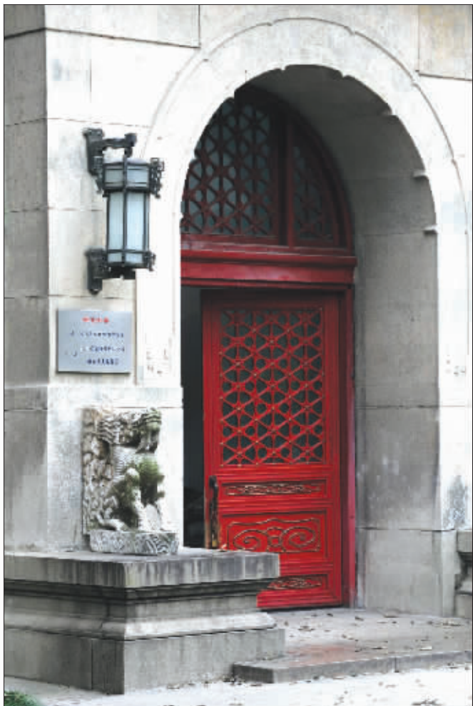
汉白玉石兽和雕花红门无不显示着建筑的精致与用心