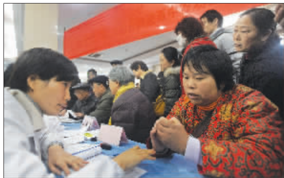
义诊现场

上周六快报携手江苏省中西医结合医院举办的“冬季皮肤病专家义诊”顺利举行。虽然当天天气不好,但前去咨询诊病的患者还是络绎不绝,更有读者专程从高淳赶到义诊现场。记者受一些读者的委托也加入了咨询大军,帮他们寻医问药。所以本期我们将整理部分读者的疑问及义诊现场的典型病例,希望对未到场的读者能有所帮助。