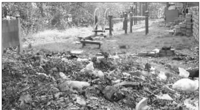
垃圾堵路,居民不再“光顾”,健身设施被荒废了3年之久