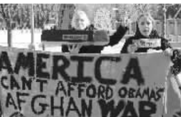
奥巴马在西点军校宣布将向阿增兵3万(左为反战人士在白宫附近举行示威)