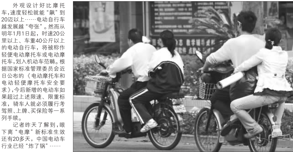
电动自行车已成为普遍而危险的交通工具