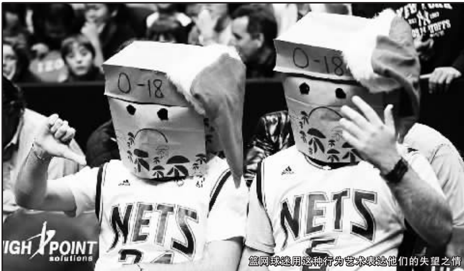
篮网球迷用这种行为艺术表达他们的失望之情