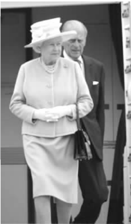
英女王伊丽莎白二世和王室成员爱丁堡公爵