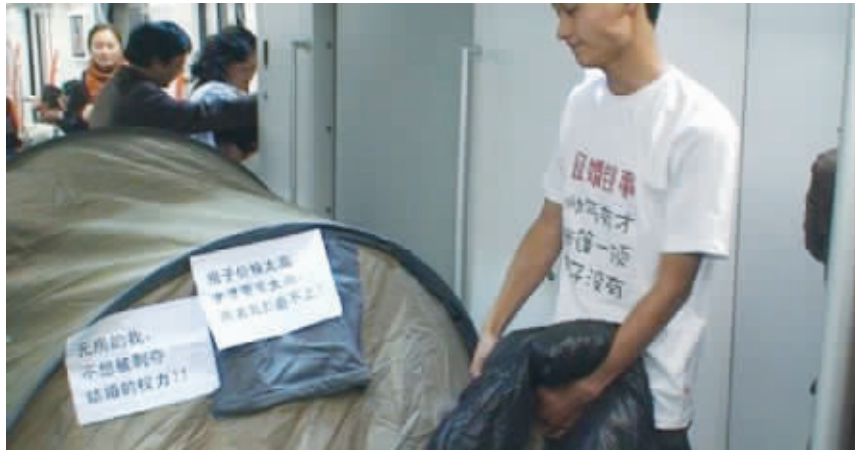
上海一白领地铁内搭帐篷征婚现场

上海地铁“行为艺术”已经是屡见不鲜,也雷人无数,从地铁鹿头人、超人到木乃伊等,无一例外在网络上掀起一阵风暴。日前,受热播剧《蜗居》的影响,上海地铁再现行为艺术。据网友爆料,上海一小白领以“蜗居”之名,在地铁列车里搭帐篷征婚,并宣称“房子价格太高,老婆要求太高,两者我都追不上”、“无房的我,不想被剥夺结婚的权利”。该“蜗居”征婚不仅将地铁乘客雷得里嫩外焦,也将网友雷得惊呼“受不了”。