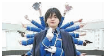
雷人制服版“千手观音”