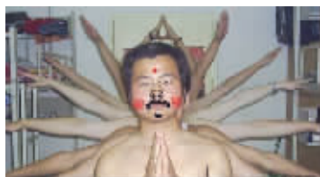
大学宿舍八戒版“千手观音”