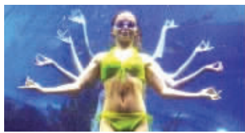
比基尼水下“千手观音”