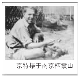
京特摄于南京栖霞山