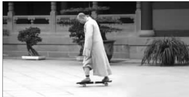
僧人在寺庙里玩滑板