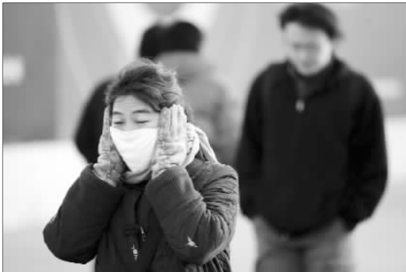
马上就要天寒地冻,请把最厚的衣服穿上吧

受冷空气不断南下影响,今天起至周三江苏地区将经历一场雨雪天气,从周四开始雨雪渐止,但气温将都降到0℃以下,南京将跌至-4℃,天气一直寒冷,全省有冰冻。