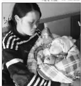
孩子的母亲很无助