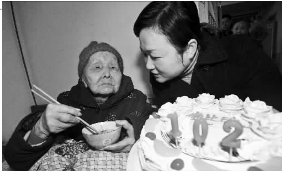
老人过102岁大寿,社区工作人员前来祝贺

在场的街坊们说,从小看着小菲长大,心底里都佩服这个姑娘。在他们的印象中,长大后的小菲除了上班,其余时间都围着奶奶转。清早出门,常看见这小