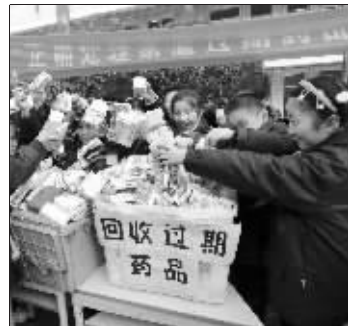
昨天,孩子们将过期药带到学校集中处理。

过期药品怎么办?珠江路小学的学生们做了一件有意义的事情:他们利用节假日调查后发现,九成的市民不知道如何处理过期药品,只有6%的市民知道每年有一到两次专门回收过期药品的活动。为此,他们给南京市食品药品监督管理局写信,提出药品回收的建议。昨天早晨,南京市药监部门专门来到珠江路小学,集中处理了学生们从家中带来的近千盒过期药品。