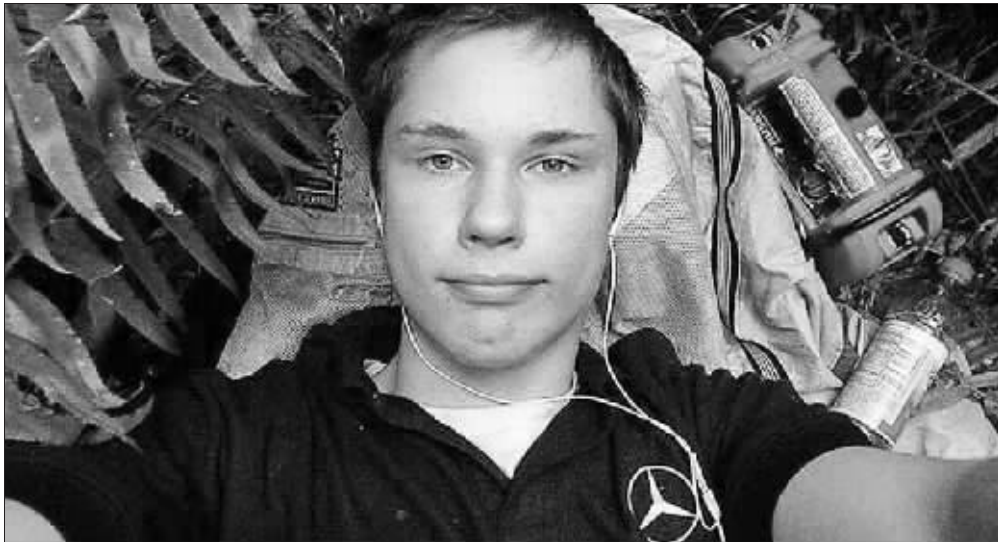
科尔顿的一张自拍照

不过,警方从来没抓到过科尔顿,甚至只从被他丢弃的照相机里看到他的模样——他似乎只存在于人们的想像和传说中。