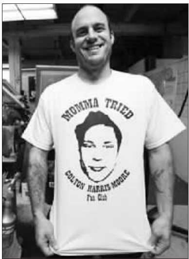
粉丝们穿着印有科尔顿头像的T恤

12月21日提前出版的《时代》周刊这样描述科尔顿·哈里斯-摩尔:18岁、消瘦、高大(1.96米),有一双滴溜溜的眼