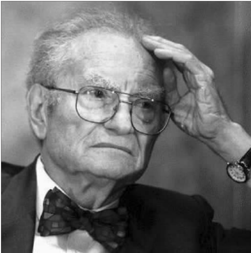
保罗·萨缪尔森 资料图片

硕士和博士学位。他的导师汉森 是凯恩斯主义在美国的主要代 表人物。最初,萨缪尔森并不 能接受凯恩斯主义,特别是其关 于某种程度的失业难以避免、 只能容忍的观点。