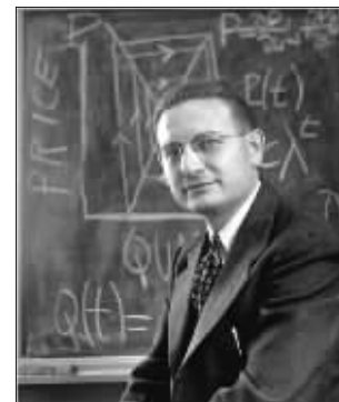
1950年,萨缪尔森在麻省理工

缪尔森的经济理论受到了来自 各方面的挑战。萨缪尔森也 从其他学派的经济理论中吸 收了许多重要的理论观点, 对自己的理论加以修正和 完善,使之适合于变化的 经济情况。