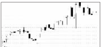
国电南自11月30日“送红包”走势