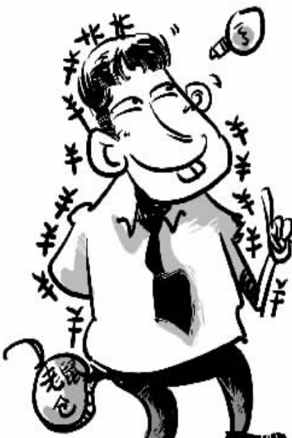
本版漫画 俞晓翔 本版制图 李荣荣

吴亮说,现在的市场,拥有上百亿资金的主力机构多了,以前游资的做法就行不通了,“你看,涨停板敢死队都逐渐淡出江湖了。”