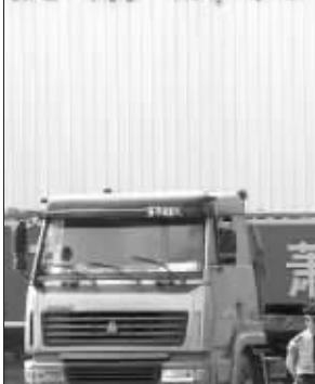
杭萧钢构案震惊全国 资料图片