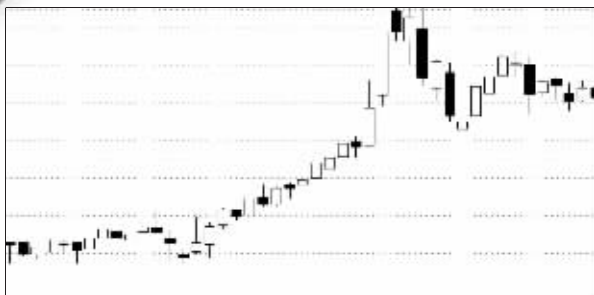
广安爱众11月12日“送红包”走势

在11月30日9点55分,出现30万股卖单。 蒋伟同时指出,也不能简单地从走势上判断“送红包”,还要看卖单的大小。一般市值上百万甚至上千万的单子“送红包”可能性更大,而一些小卖单,是操盘手误操作也有可能。这在一些成交不活跃的股票中出现过,另外在债券交易中也会出现,但可以肯定的是,在一段时期频繁出现这样的现象,是不正常的。