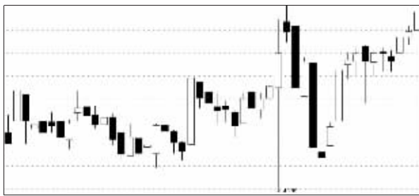
海螺水泥11月20日“送红包”走势