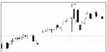
华升股份11月23日“送红包”走势