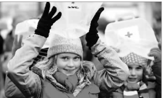
12月15日,在丹麦首都哥本哈根,学生们参加“水步行”活动,表达对水资源匮乏地区的支持。

未来5年内帮助发展中国家尽快掌握可再生能源技术和提高能效的技术,以减少温室气体排放,减少对化石能源的依赖。意大利和澳大利亚的代表也同时宣布将为这项计划出资。朱棣文还提议,明年召开世界首次清洁能源部长级会议。