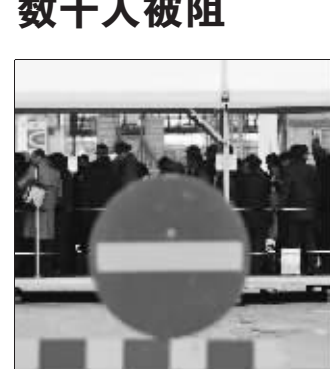
数千人被阻会场外 新华社发