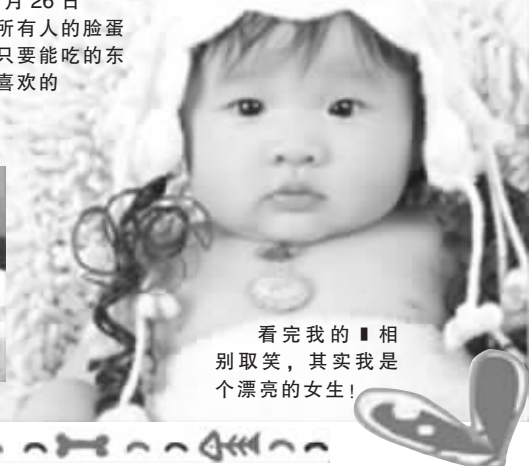
看完我的相别取笑,其实我是个漂亮的女生!