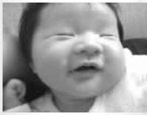
梦见好吃的了,好开心!