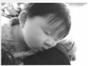
662号萱宝贝 生日:2009年6月26日 最喜欢的事:捏所有人的脸蛋 最喜欢的食物:只要能吃的东东,好像没有不喜欢的