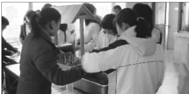
“向阳渔港”食堂的饭菜,学生们很爱吃