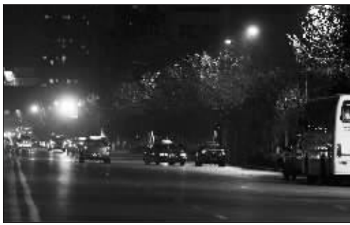
红山路的路灯比较昏暗

听说过嫌没路灯、嫌路灯暗的,可没听说嫌路灯亮的。昨天,市民姜女士就向快报热线反映:“中山东路出新后,路灯比以前亮了,特别是下雨天,有点刺眼。”无独有偶,市民陈先生则反映:红山路等地的路灯太暗了,看不清路!看来,还真是众口难调啊。