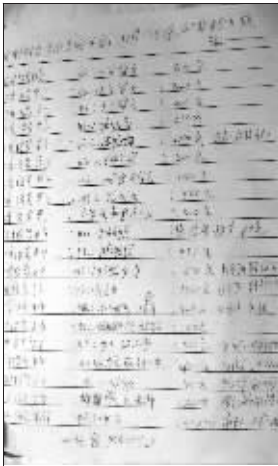
病友家属帮忙记录的捐款明细